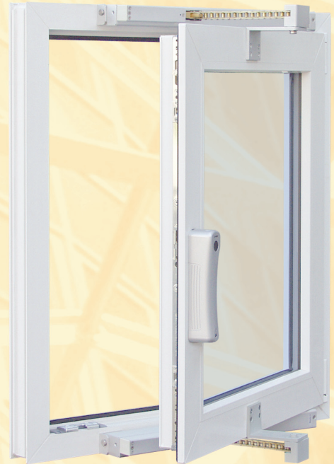
SHD 54/450-BSY+ mit / with FRA 11-BSY+